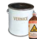
VERNICI, INCHIOSTRI ACIDI E PESTICIDI