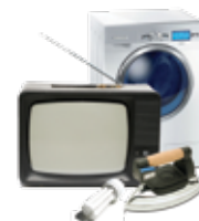
RAEE (Tutti i materiali elettrici ed elettronici)