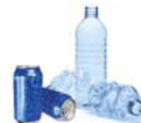
MULTIMATERIALE LEGGERO (Plastica e Lattine)