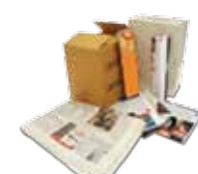
CARTA, CARTONE E TETRA PAK