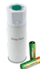
PILE ESAUSTE E BOMBOLETTE SPRAY