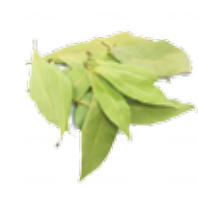
SFALCI E POTATURE